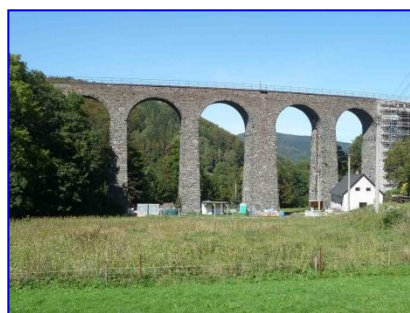
Železniční viadukt Smržovka