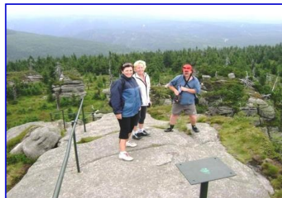
Hora Jizera - 1122 m