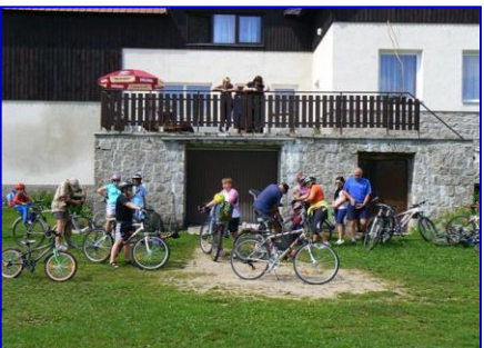
Pojedeme na kole