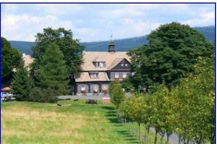
Šámalova chata na Nové louce