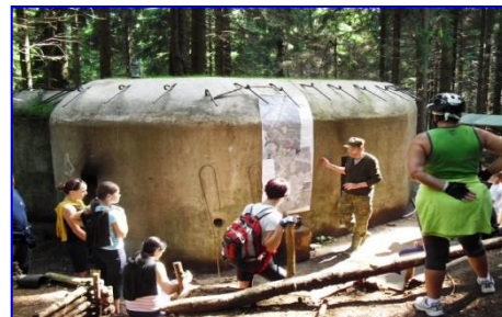
Bunkr pod Štěpánlou