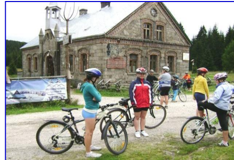
Polská osada Orle