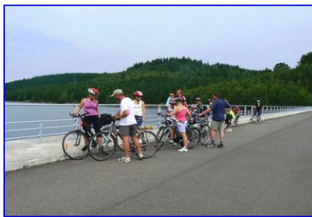
Vodní nádrž Josefův Důl