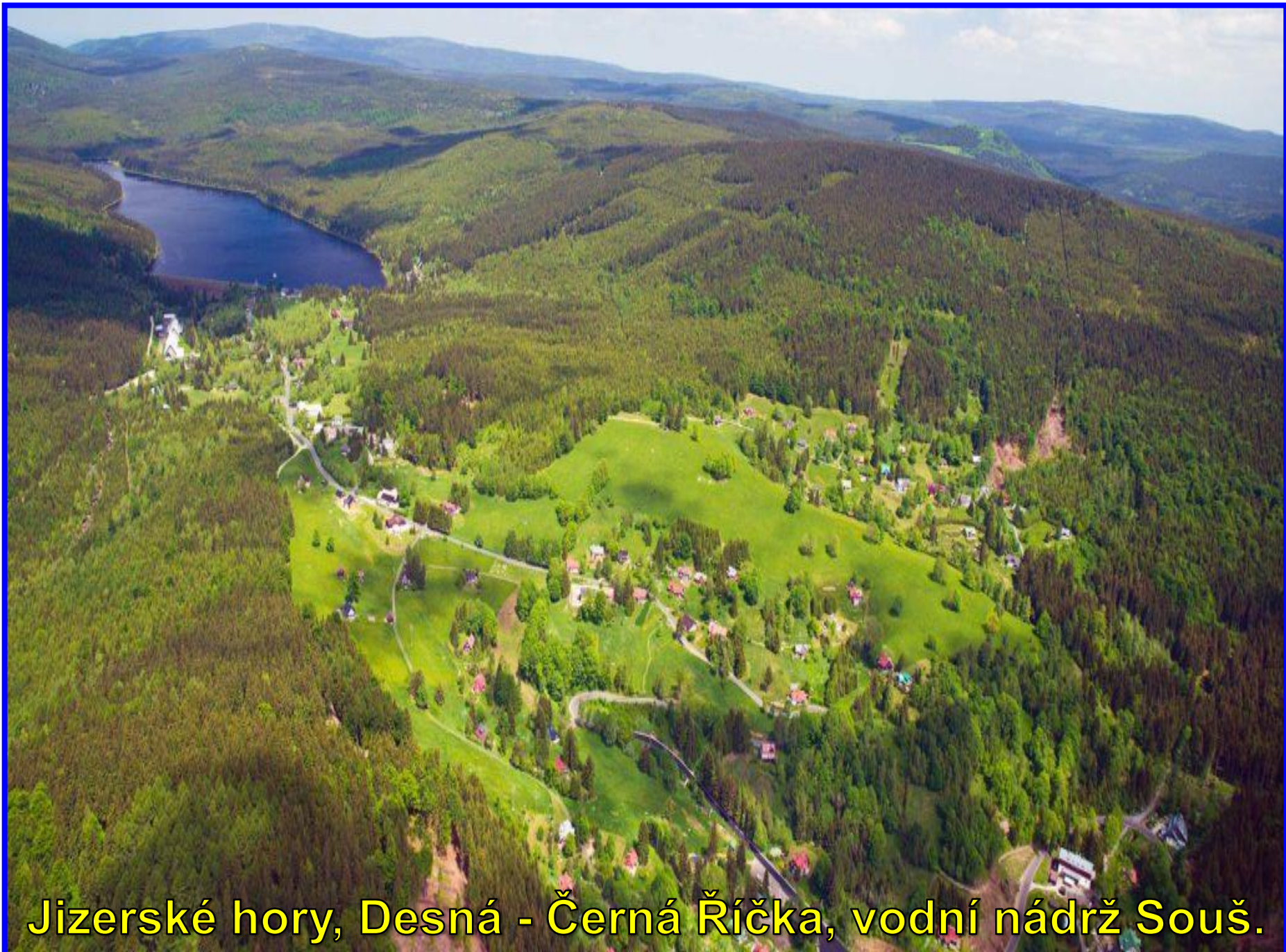
Jizerské hory, Desná - Černá Říčka, vodní nádrž Souš.