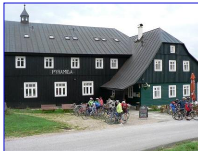
Osada Jizerka chata Pyramida